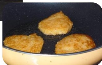
食感もよく 大変美味しくいただきました