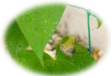
カエルも日陰で休憩中