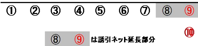
栽培コンテナ配列図