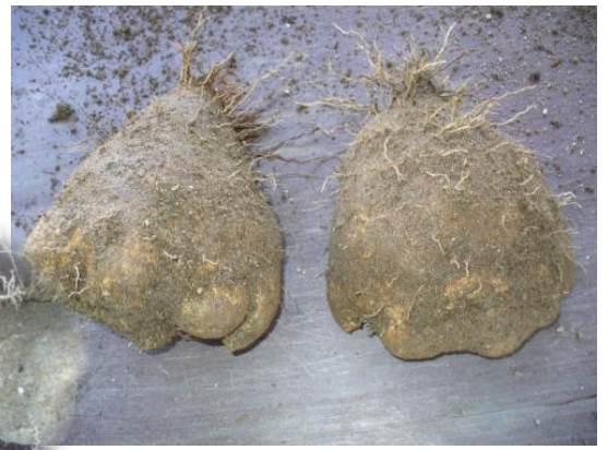
立派なダイショ芋が収穫できました