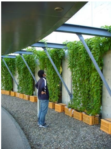
ずいぶん成長しました