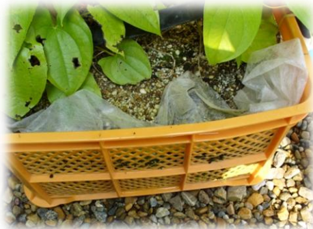
期待と共に コンテナも膨らんでいます