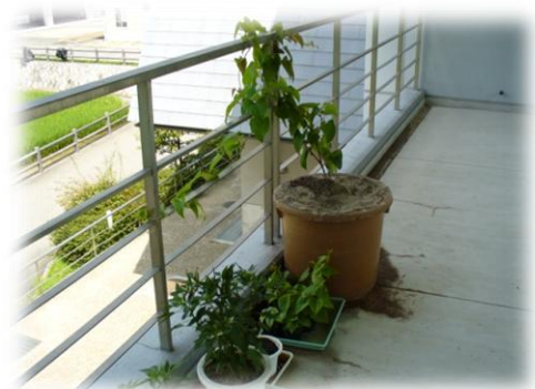
2階のベランダで成長しています