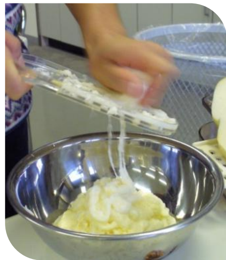
ねばりがあっていい感じです