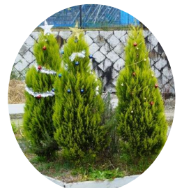
資源植物学研究室一同