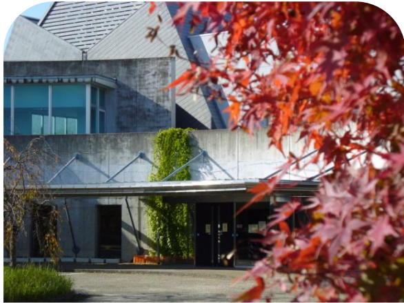
紅葉の季節になっても ダイショの葉は緑色を保っています