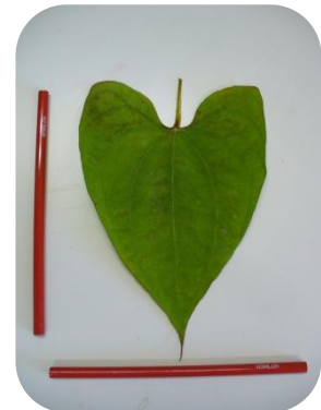
葉の大きさ・形 (綺麗なハート形をしています)