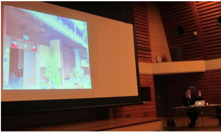
写真1：亀岡市地域活用実行委員会主催講演会「フォーラム地域のたから：文化遺産とまちづくりについて」 （2012年10月21日，於：亀岡市総合福祉センター）