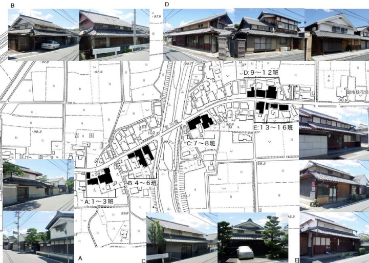
図1：篠山街道沿いにおける伝統民家の外観事例