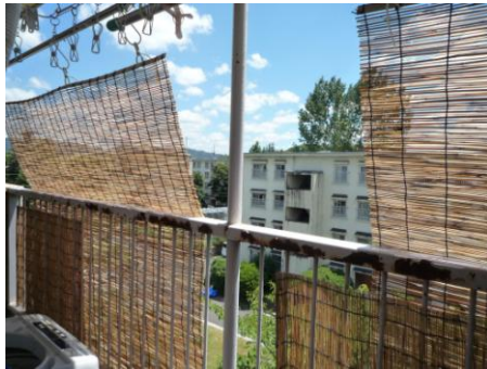
写真2 ベランダにすだれ設置