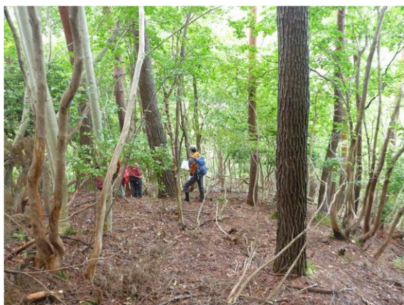
写真 1：アカマツ優占林内の様子