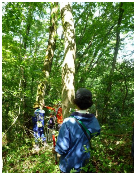
写真 2：コナラ優占林内の様子