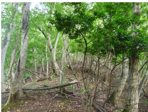
写真 3：イヌシデ・コナラ優占林内の様子