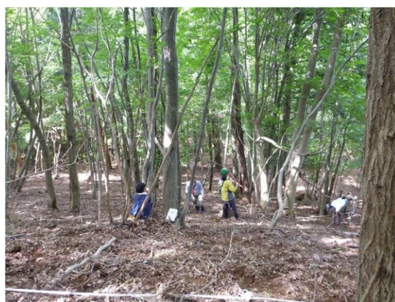
写真 4：ホオノキ・タカノツメ優占林内の様子