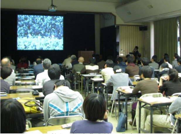
地域貢献を目指す農業技術講演会

地域貢献を目指す農業技術講演会(生命環境学部と京都府農林水産部との共催講演会の運営) 年1回