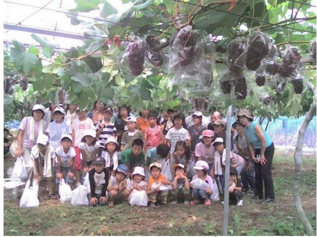
ユーカルチャーデー