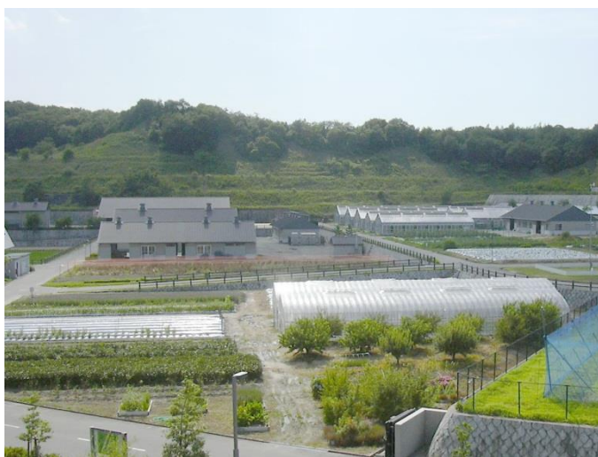
温室、花卉・そ菜ほ場