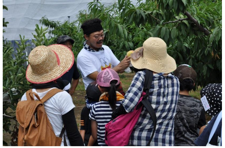
ユースカルチャーデー