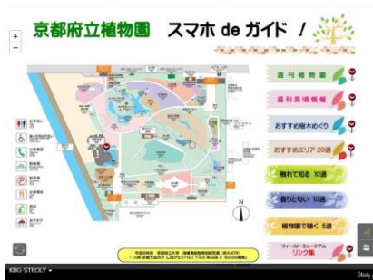
植物園 スマホ de ガイド