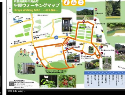
美山町平屋ウォーキングマップ