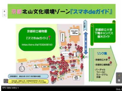
京都北山文化環境ゾーン

【「仮想の京都野外博物館」(Virtual Field Museum of Kyoto)】 https://stro.li/a/1553575569