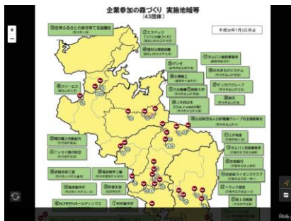
京都モデルフォレスト運動