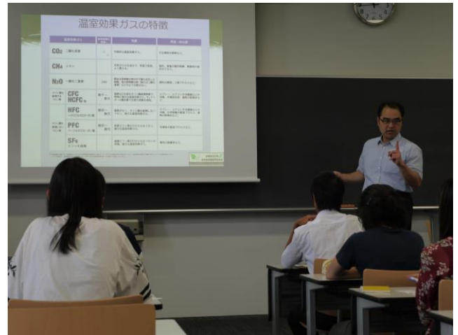
稲盛記念会館でのバイオマスに関する講義