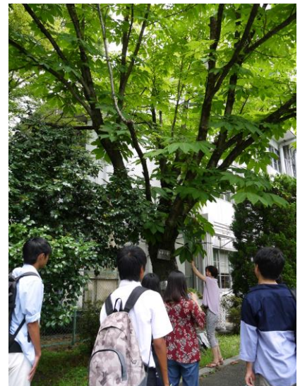
キャンパス内の樹木観察