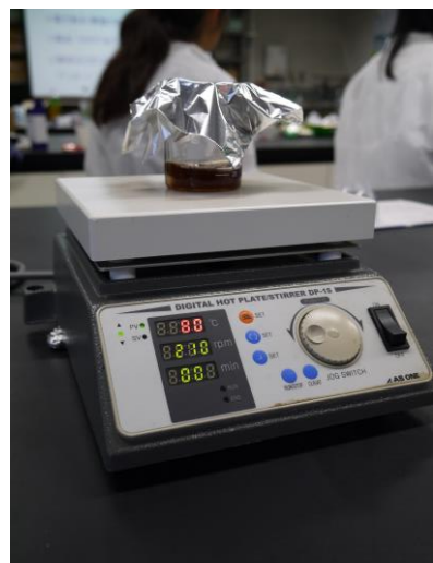
木材を溶かす実験