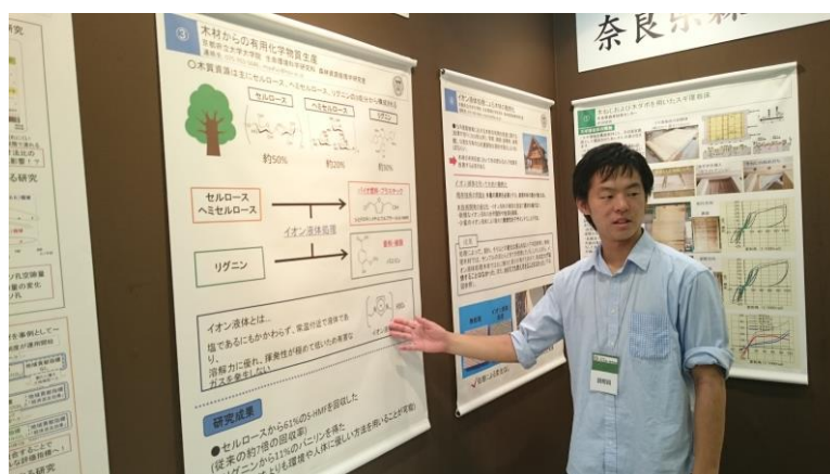
ポスターを説明する様子①

木材産業関係者、建材・住宅設備機器メーカーや一般の家族連れなどの幅広い層の来客があり、本学科の研究を知ってもらう良い機会となりました。