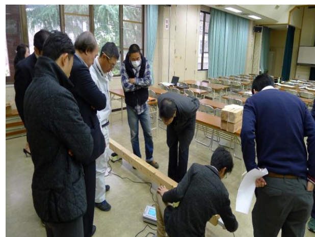
グレーディングマシンを用いた測定講習の様子