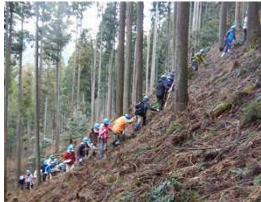
調査地まで山を登る