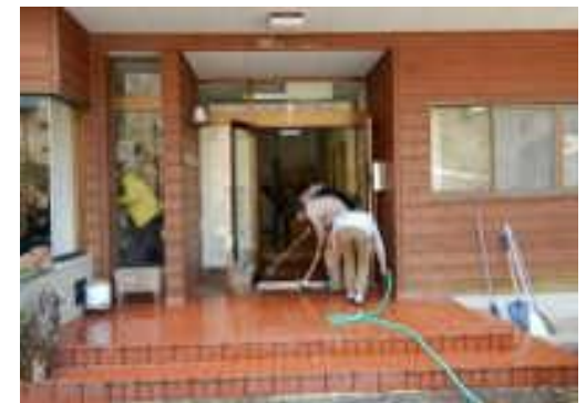
最後はしっかり掃除しました