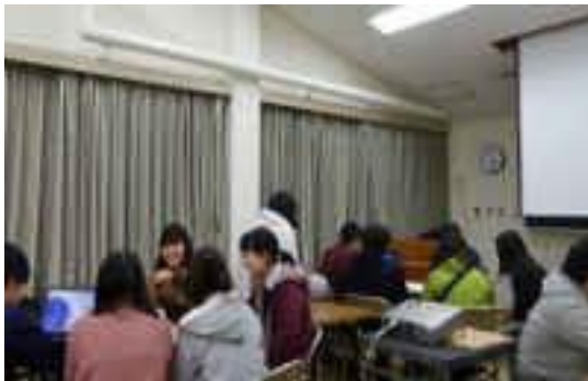
調査結果をグループごとに話し合ってみる