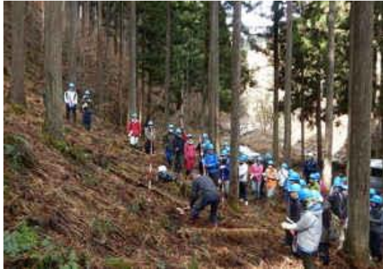
土壌調査のやり方を説明