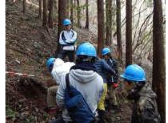
自分たちで掘って調査，データ取り