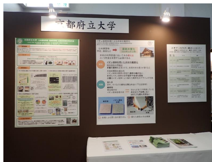
研究内容のポスター

“住まいの耐震博覧会”では建材・住宅産業メーカーをはじめ、木材産業関係者や一般の家族連れなど幅広い層が約1万人来場し、多くの人に本学科の研究内容の一例を知っていただく貴重な機会となりました。