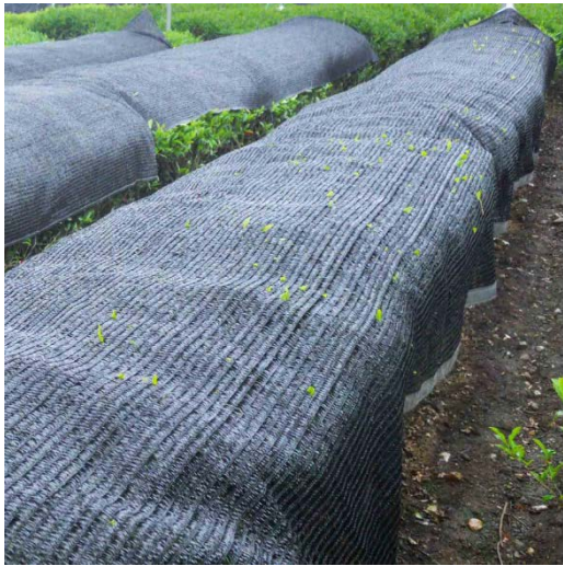
被覆栽培（遮光栽培）