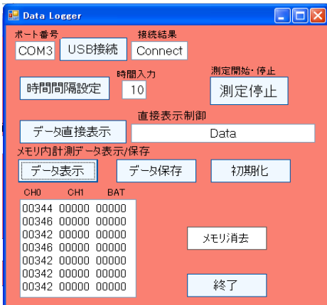
図 1 作成したパソコン上の操作画面

パソコン側から、データの管理、操作を容易にするため、Visual Basic で操作画面(図 1)をパソコン上に作った。この画面から、データロガーの接続、測定開始・停止、測定時間間隔設定、パソコンへのデータ保存、データ初期化、データ表示、メモリ消去などの命令が実行できる。