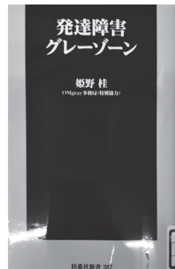
(写真)『発達障害グレーゾーン』姫野桂著 扶桑社新書、2019年