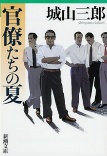
新潮社, 2002.3 (請求記号 913.6||S)

人間の住む家には、身近な場所に20万種を超す生き物が住み着き、複雑な生態系を作りあげている。それらが私たちの健康や暮らしに害を及ぼすのか、徹底的に除菌すると生態系はどうなるのか。家の生態学研究からわかった屋内生物の役割と、上手な付き合い方を教えてくれる一冊です。読み終えたら、これまで見てきた家の風景が一変するかもしれませんよ。