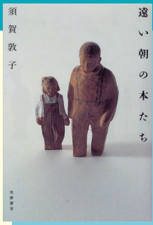
筑摩書房, 1998.4 (請求記号 914.6||S)

後にクトゥルー神話として体系化される「宇宙的恐怖」を描いたラヴクラフトの傑作選。タイトルに並ぶワードは、近年ではTRPGやソーシャルゲーム、ライトノベルで知った人も多いだろう。その人気にあやかっただけで2010年代から新訳が複数出版されている。不可解で理不尽で人知を超えた恐怖の対象は、今となっては映画や小説、ゲームによって身近になってしまった。20世紀初頭に生まれ、後のホラージャンルに多大な影響を残す原点を知る良い一冊だ。