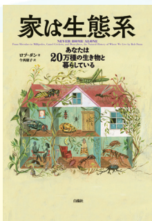
白揚社, 2021.2 (請求記号 468||D)

1953年にパリ・ローマへ留学後、長くイタリアに住み、帰国後に大学で教鞭をとる傍ら61歳で作家デビュー。自身の体験を滋味豊かな文章で描いた著者が、道しるべとなった本との出会いを綴ったエッセイです。「本の世界が夏空の雲のように幾層にも重なって湧きあがり、その子自身がほとんど本になってしまう」少女期を経て、人生を通して求め、受けた読書のよこびに触れながら、ゆっくりと気になる本を見つけてみてください。