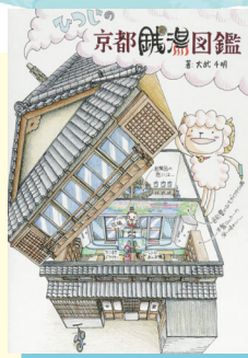
創元社, 2016.2 (請求記号 291.62||O)

約40年にわたって海の色を研究してきた著者が撮影した波の写真を、海の色誕生から消滅に至る一生として配列した一冊。さざ波、風波、三角波、破波、うねり等、様々なかたちの波が写真と合わせてわかりやすく解説されています。風のエネルギーを吸収して生まれ、太陽の光を反射して輝く。様々な波を見ていると、それぞれ異なった波の音が聞こえてくるようで、とにかく海が見たい！そんな気持ちにさせられる本でもあります。