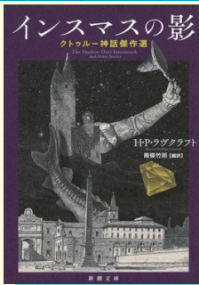
新潮社, 2019.8 (請求記号933.7||L)